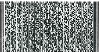
Timbre Electrónico SII

R.U.T.: 78.885.550-8 BOLETA ELECTRONICA N° 12.731.282 S.I.J. - SANTIAGO ORIENTE